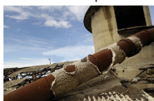
o) Calorifuges amiantés sur conduit métallique