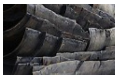
q) Conduits revêtus de peinture bitumeuse amiantée