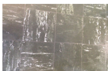
k) Dalles en vinyle amiante