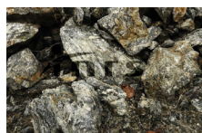
p) Roche amiantifère