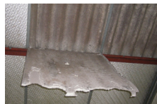
h) Dalles de faux plafond de type Panocell