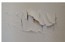
m) Peinture amiantée