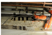
r) Poutre métallique recouverte de flocage amianté