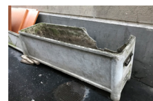
l) Mobilier de jardin en amiante ciment