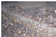
g) Couches de revêtement routier contenant de l'amiante