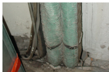
f) Tresse isolante de câble électrique haute tension