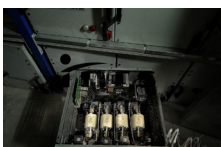
n) Protecteurs de disjoncteurs en amiante