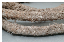
s) Joint-tresse amianté de dilatation