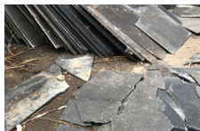
e) Fausse ardoise en amiante ciment